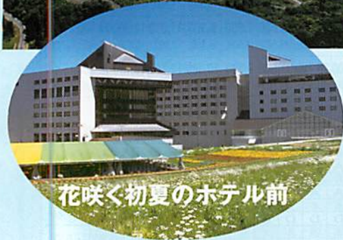
花咲く初夏のホテル前