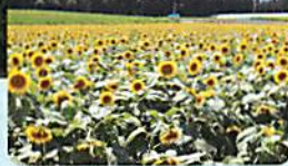
ひまわり畑 (7/下旬~8/中旬)