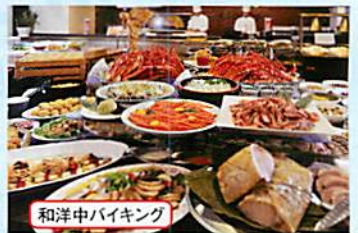
和洋中バイキング