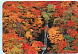
秋山郷の紅葉 (蛇沼の滝)