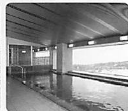
展望温泉大浴場(露天風呂付)