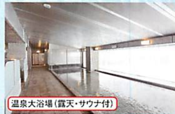
温泉大浴場 (露天・サウナ付)